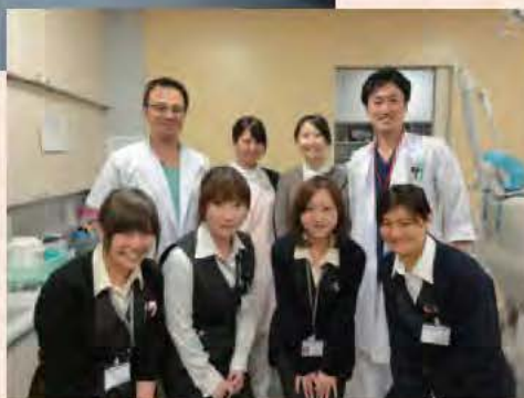
(歯科・歯科口腔外科のスタッフ)