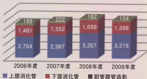
当院の内視鏡検査数

(解説) 肛門からバリウムを入れて大腸のX線撮影をする注腸造影という検査が以前は主流でした。しかし、便のかすが残っていると小さなポリープを見つけにくいこともあり、より小さな病変を見つけやすい大腸の内視鏡検査が主流になってきています。また最近では、口から小さなカプセルを服用し、写真を撮影しながら消化管全域を観察するカプセル内視鏡という検査も実施されてきています。現在、大腸の内視鏡検査で最も優れている点はQ1にも記しましたが、内視鏡で診断と治療の双方を実施できる点です。